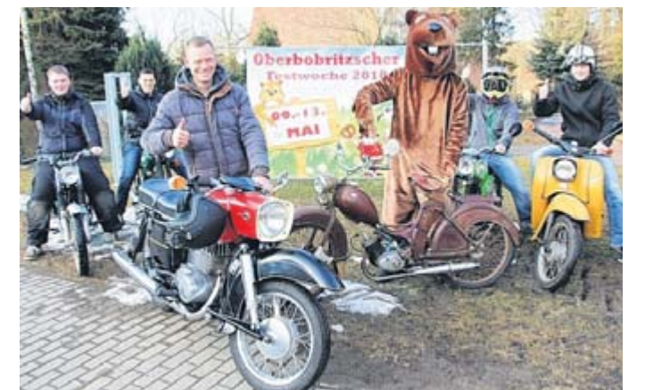
Biber, Organisatoren und Streckenposten machen sich auf die Fahrt, um die Strecke der Oldtimerausfahrt abzufahren.

Piwarz: „Ich bin mir sicher, dass dieses Handlungsprogramm mittelfristig einen Schub in der Nachwuchsgewinnung auslösen wird.“ Das Handlungsprogramm ist einsehbar unter www.bildung.sachsen.de/blog . rih